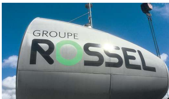
L'éolienne fait 130 mètres de haut et a une puissance de 2,35 MW.