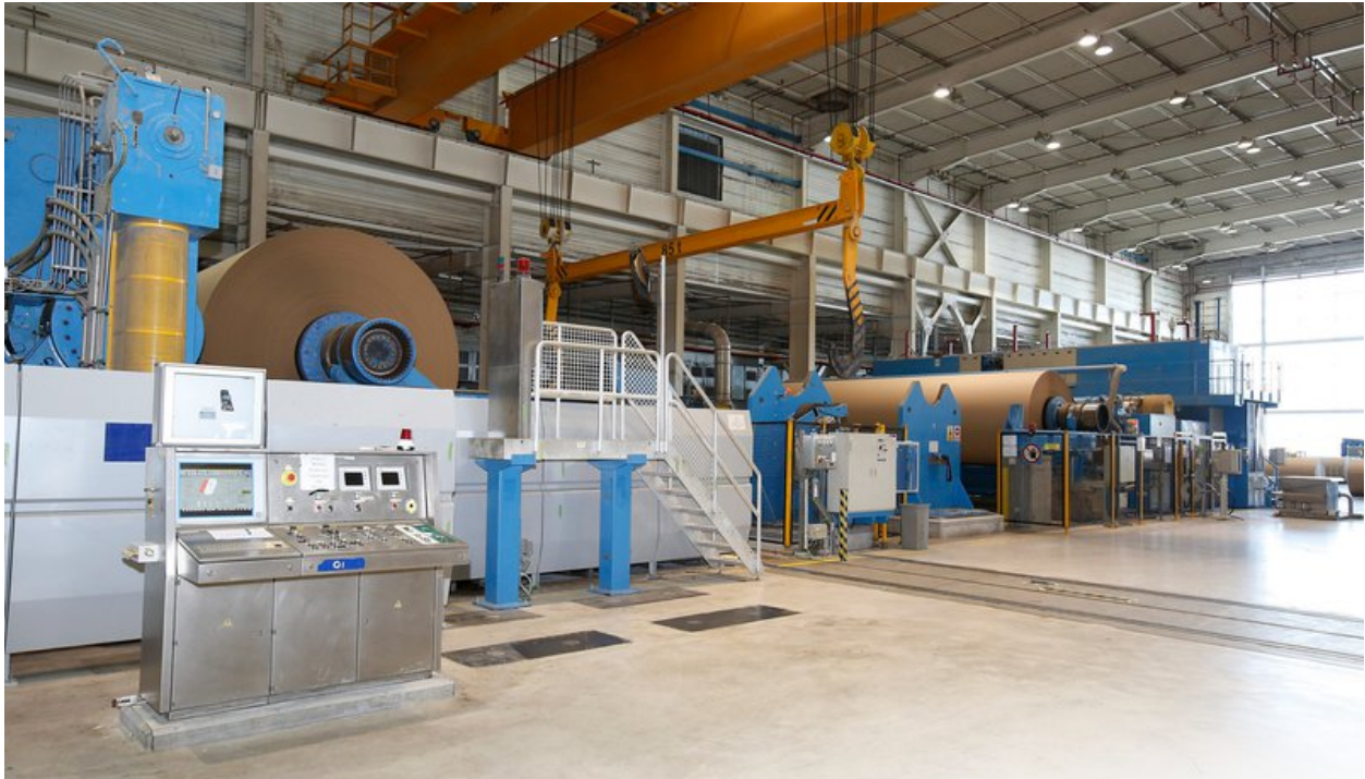
Papierfabriek in Madrid IP

eigen inzamelsysteem voor oud papier. Veel van onze Spaanse klanten zijn zich zeer bewust van de circulaire economie en lokale recycling en we werken nauw samen met hen en andere lokale partners om deze doelen te bereiken. We hebben twee duurzaamheidsprijzen gewonnen voor onze inspanningen in Spanje. We produceren geen golfpapier met nieuwe vezels in Europa, maar ontvangen het merendeel van onze kraftliners van onze Amerikaanse fabrieken. Hierdoor kunnen we profiteren van een uitstekende Noord-Amerikaanse lange vezelkwaliteit. Naast het verantwoord inkopen van vezels, optimaliseren we ook ons gebruik van vezels door continue verbetering in het verminderen van afval van onze fabrieken.