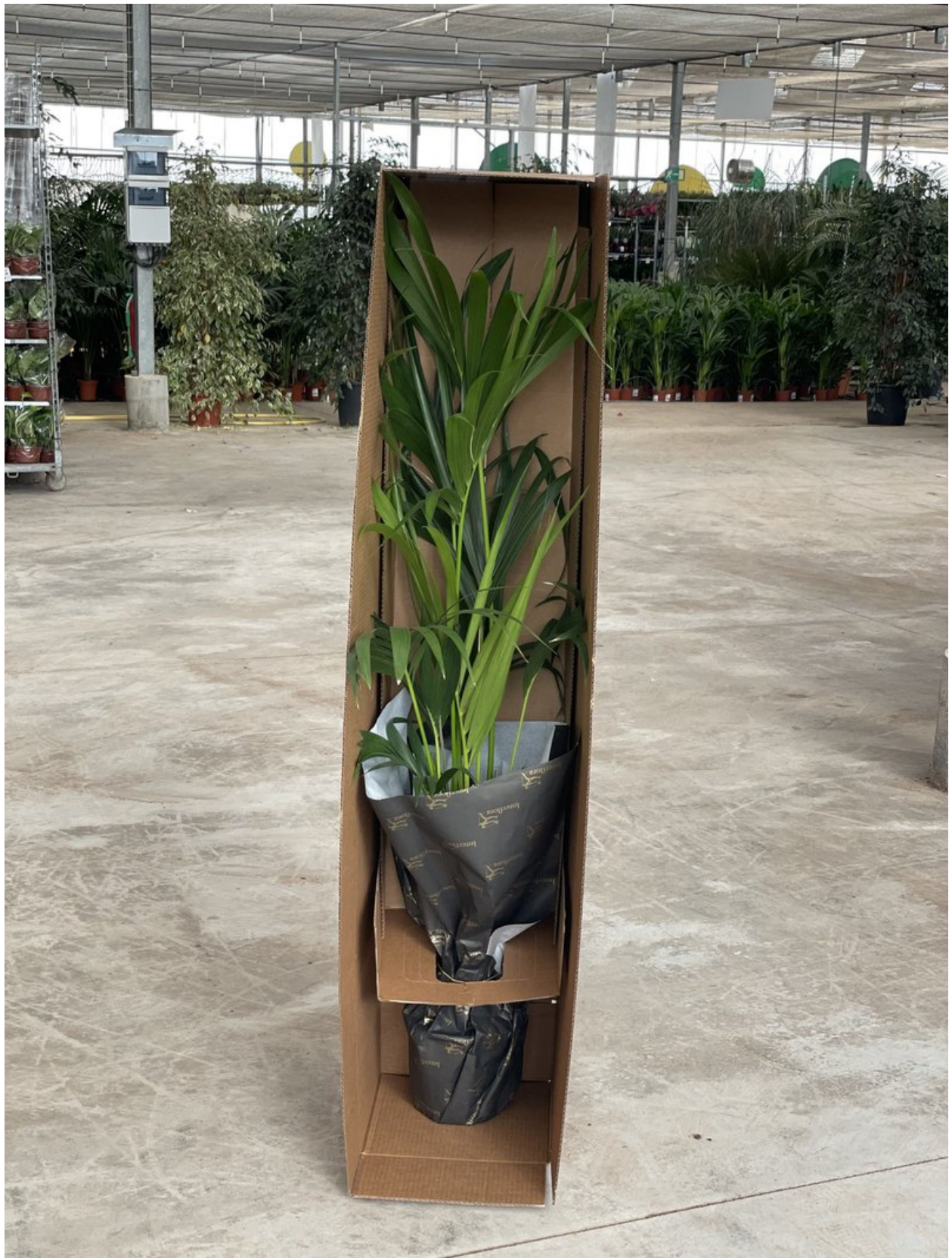
Voorbeelden van verpakkingen IP