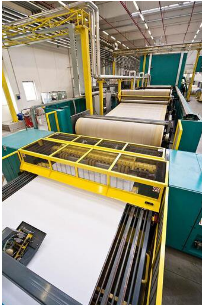
Fabriek in Italië voor golfkartonnen verpakkingen IP

De spin-off van de grafische activiteiten, die wereldwijd een lichte terugval vertonen, maakt deze heroriëntatie mogelijk. IP bezit nog steeds 19,9% van Sylvamo, maar slechts voor een korte tijd. Door twee afzonderlijke bedrijven te exploiteren, kan voor elk meer waarde worden gecreëerd door middel van een meer gerichte strategie.