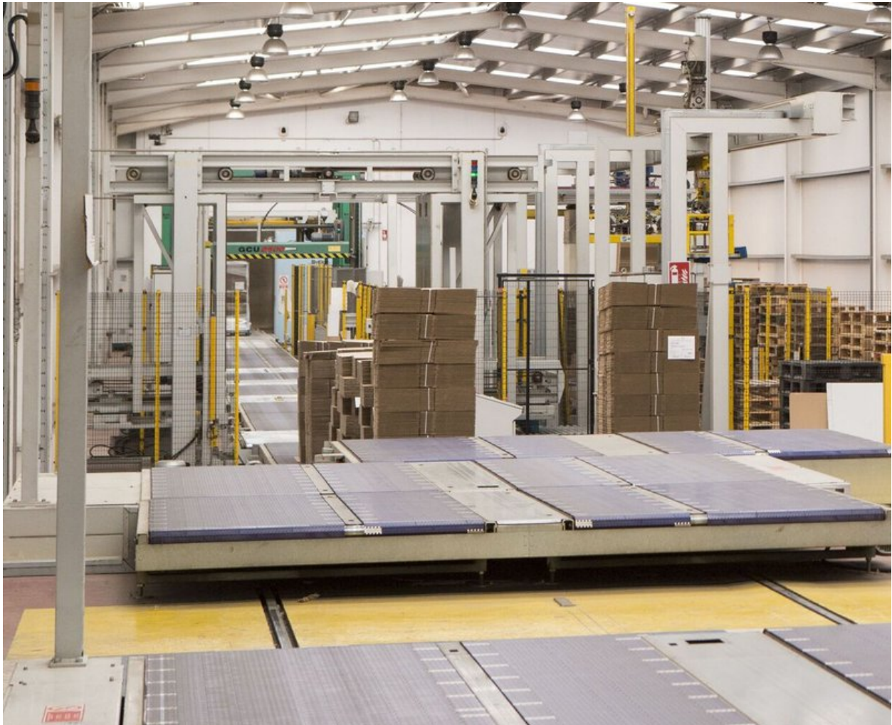
Papierfabriek in Madrid IP

Het is geen geheim dat de papier- en kartonindustrie als geheel traditioneel is en moet worden gemoderniseerd. We werken daarom aan al onze end-to-end-processen om elke stap te optimaliseren en contactloze processen te ontwikkelen. De digitale transformatie vindt bijvoorbeeld plaats met de vervanging van oude energieverbruikende apparatuur door efficiëntere machines.