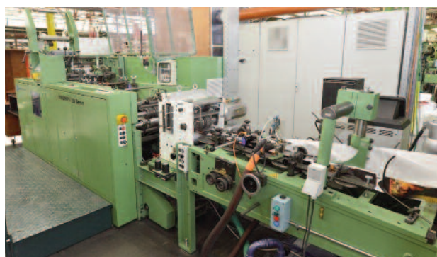
Une machine à sac